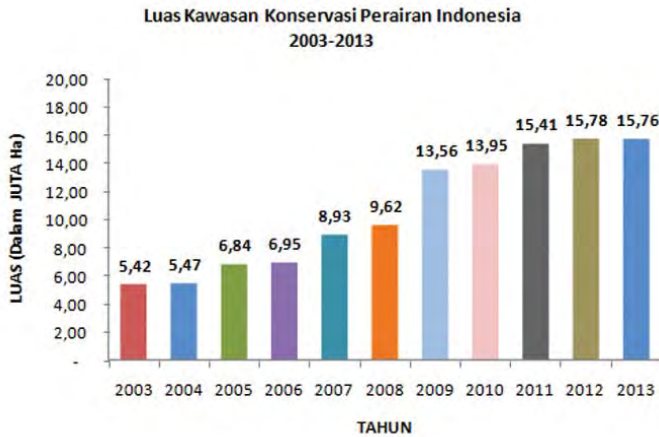
Gambar 1. Perkembangan luasan Kawasan Konservasi Perairan Indonesia