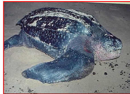
Gambar 4. Penyu Belimbing ( Dermochelys coriacea )