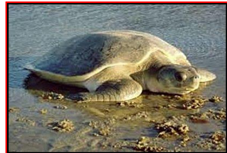
Gambar 6. Penyu Pipih ( Natator depressa )