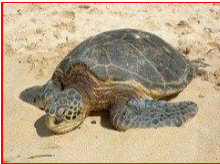
Gambar 3. Penyu Tempayan ( Caretta caretta )