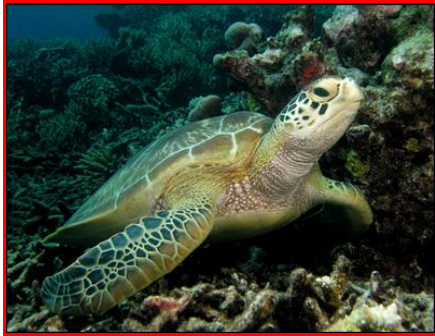
Gambar 1. Penyu Hijau ( Chelonia mydas )