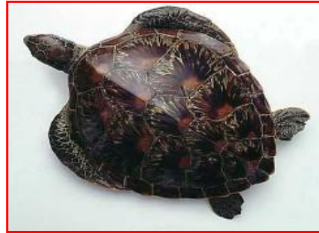
Gambar 2. Penyu Sisik ( Eretmochelys imbricata )